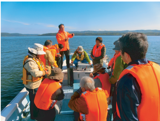
網走湖湖上での見学