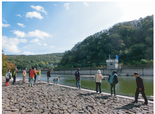
網走川の塩水遡上抑制可動堰での見学